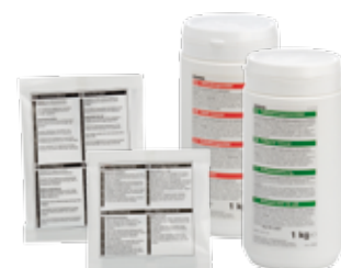
Entkalkungsmittel und Kaffeiansatzlösung